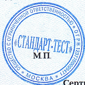
Схема сертификации: 1с.